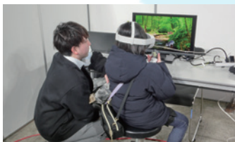
VRゴーグルで地震後の森を探索しよう