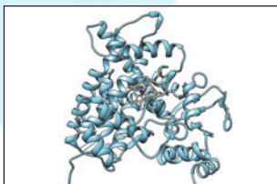
女性研究者のリアル研究ライフ①