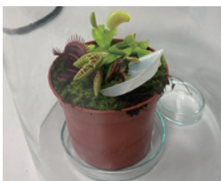
植物に麻酔は効きますい?