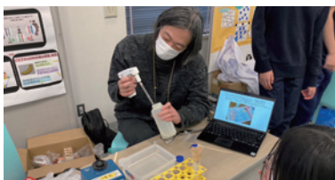
生命の設計図を取り出せ!DNAを見てみよう