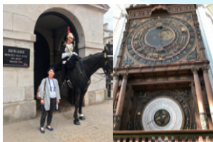
女性研究者のリアル研究ライフ②