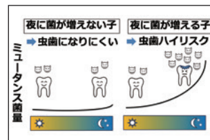
夜更かしすると虫歯が増える?!